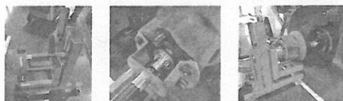
「プレーキドラム脱着治具」