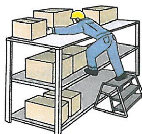
自分の動作の反動で墜落

墜落・転落災害は、滑って、踏み外して、自分の動作の反動でつまずいたり原因で事故は発生します。冬季特有の天候や寒さなど作業環境の悪化による災害も発生しますので、気をつけましょう。